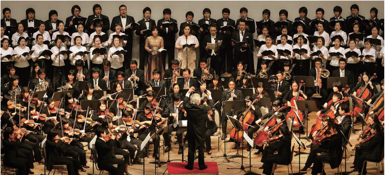
올해 Magnolia 2012 목련예술제에서 수원시립교향악단과 경희대학교 음악대학 교수진이 협연한다.

수원시립교향악단, 드보르자크 교향곡 제9번 '신세계로부터' 연주 경희 음대 교수진, 독특한 형식의 베토벤 3중 협주곡 '트리플 콘체르토' 선보여