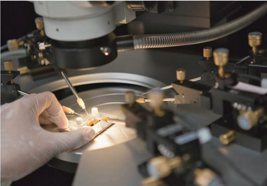
BK21 종합평가에서 '디스플레이 응용을 위한 프린팅 기초기술 연구' 사업팀이 교과부장관 표창 및 포상을 받았다.

연구중심대학 육성사업(BK21)을 통해 경희의 연구 탁월성이 확인됐다. 교육과학기술부와 한국연구재단이 최근 실시한 2단계 BK21 사업 종합평가에서 경희대는 17개 사업단(팀) 중 16개 사업단(팀)이 '우수' 이상 등급을 받았다.