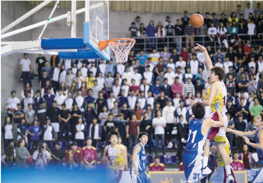
경희대 농구부가 2012 KB국민은행 대학농구리그에서 지난해 우승에 이어 대회 2연패를 차지했다.

스포츠 경희 2012년: 핸드볼부, 대학선수권대회 우승 쇼트트랙부, 전국스피드스케이팅 금 1, 은 2, 동 4 수확