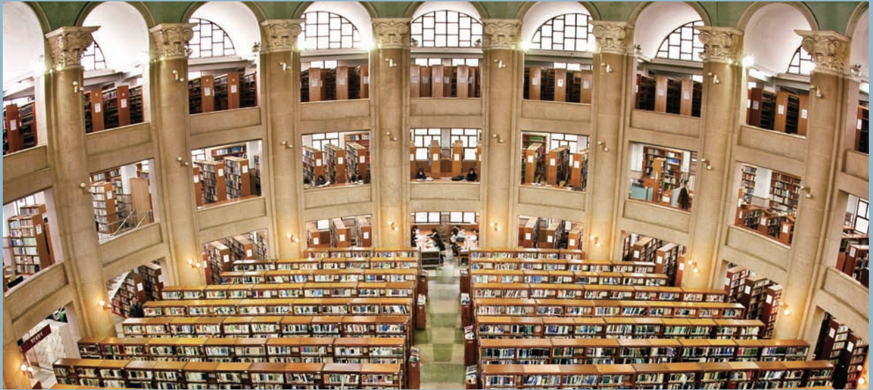
경희는 교육과학기술부의 교육역량강화지원사업 성과평가에서 3년 연속 '우수 대학'에 선정, 교육의 탁월성을 인정받았다.

경희대학교가 교육과학기술부(이하 교과부) '교육역량강화지원사업 성과평가'에서 3년 연속 우수대학으로 선정됐다. 이에 따라 올해 초 교육역량강화지원사업 선정으로 22억 9,300만 원을 지원 받은 경희대는 우수대학에 대한 인센티브로 9,800만 원을 추가 지원받게 됐다.