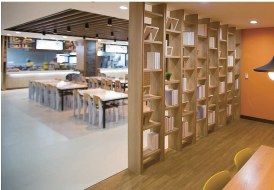
국제캠퍼스 공학관 학생식당이 커뮤니티룸과 카페를 신설하는 등 리모델링을 마치고 9월 17일 재개장했다.

커뮤니티룸·카페 신설, 학습·문화·소통 공간으로 탄생 학생들의 품질 개선 요구 수렴, 메뉴 다양화