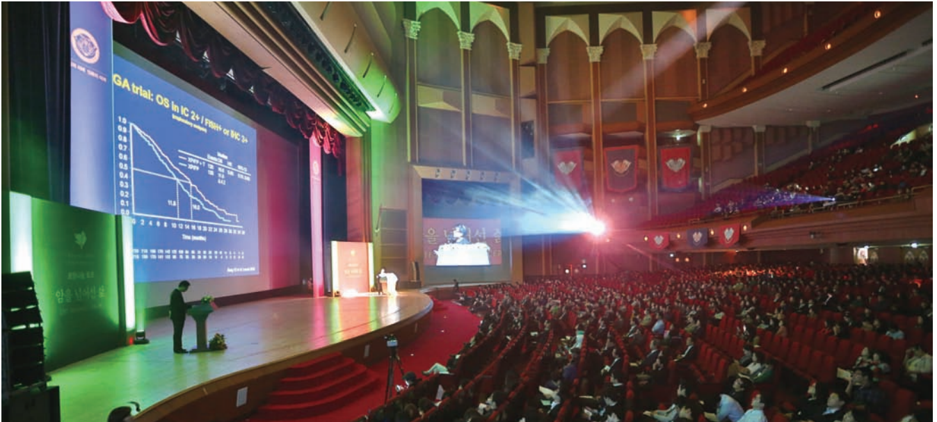
경희의료원과 경희대가 지난 10월 16일 개최한 ‘희망나눔 토크-암을 넘어선 삶’에는 환자·보호자·지역주민 등 1,800여 명이 참석해 역경을 극복할 수 있다는 희망을 함께 나눴다.

‘치유·희망·비전’ 주제로 환자와 가족에게 긍정의 메시지 전달 환자의 마음 위로하고 ‘기적을 낳는’ 암센터 건립 제안