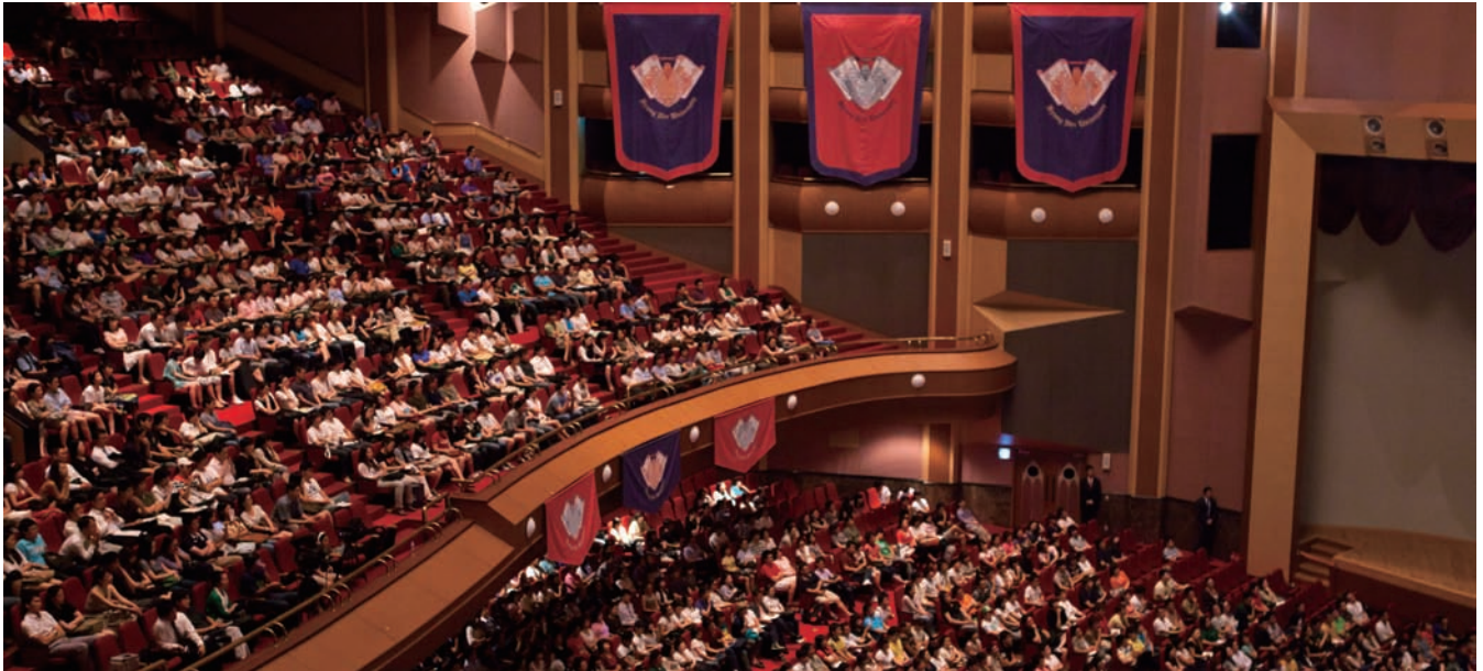
경희가족 송년회 Magnolia 2012 주제는 ‘학문과 평화의 담대한 비상’이다. 사진은 매년 행사가 개최되는 서울캠퍼스 평화의 전당.

Magnolia 2012, 미원(美源) 조영식 박사의 원대한 미래비전 창조적으로 계승 조인원 총장, “세계적인 경희’ 화두를 더 깊이 새기는 한 해로 마무리하자”