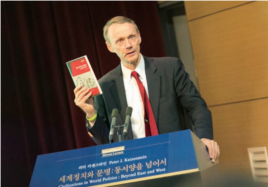
카젠스타인 교수는 “동서양을 구분하고, 문명 간의 충돌을 예견하는 것은 정치적 프로젝트”라고 비판했다.

2012 미원렉처, 세계적 정치학자 피터 카젠스타인 코넬대 석좌교수 초청 ‘세계 정치와 문명: 동서양을 넘어서’ 주제로 강연