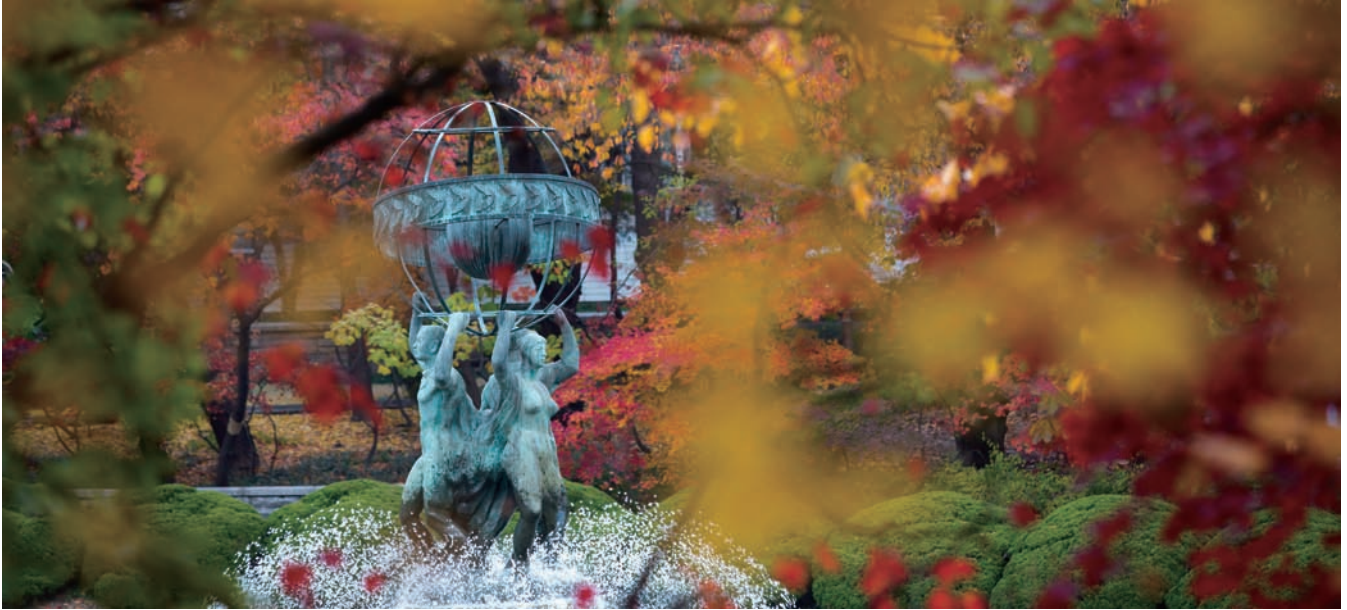
경희의 미래전략은 2019년 개교 70주년 이전에 국내 정상을 넘어 아시아 정상으로, 2029년 개교 80주년 이전에 세계 정상권 대학으로 도약한다는 비전을 갖고 있다.

개교 70주년까지 아시아 정상, 개교 80주년에는 세계 정상권 도약 5개 연계협력 클러스터 구축, 융복합 통해 경희의 교육·연구 정체성 확립