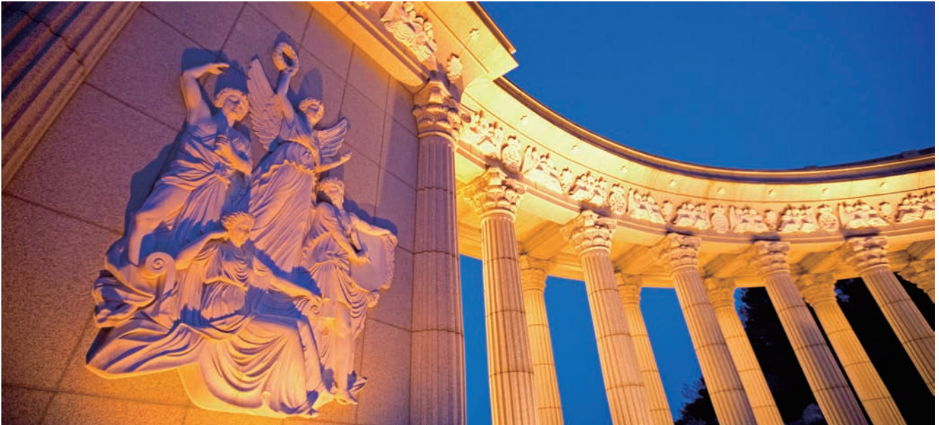
‘학문의 평화’의 전통 속에서 새로운 명문의 조건을 모색해온 경희는 2013년에도 미래대학의 길을 힘차게 열어갈 계획이다.

2012 경희, 교육·연구·실천 전 영역에서 탁월한 성과 이뤄 목련상 수상 이동훈 교수, 우주 탐사용 초소형 인공위성 발사 성공