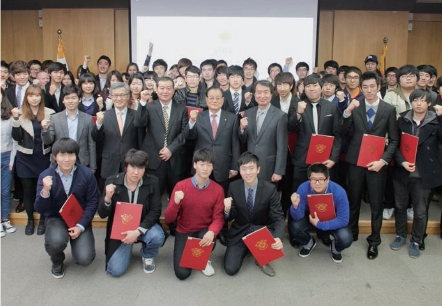
올해 131명의 학생에게 '매그놀리아 스토리' 장학증서가 전달됐다.

경희대학교의 발전기금 소액모금 프로그램 '매그놀리아 스토리 (Magnolia Story)'를 통한 장학 규모가 점차 확대되고 있다. 경희대학교는 지난해 매그놀리아 스토리의 첫 장학생 44명을 배출한 데 이어, 올해 131명(서울 74명, 국제 57명)의 학생에게 장학금을 전달했다. 장학금 규모도 3,906만 원에서 1억 2,829만 8,000원으로 늘었다.