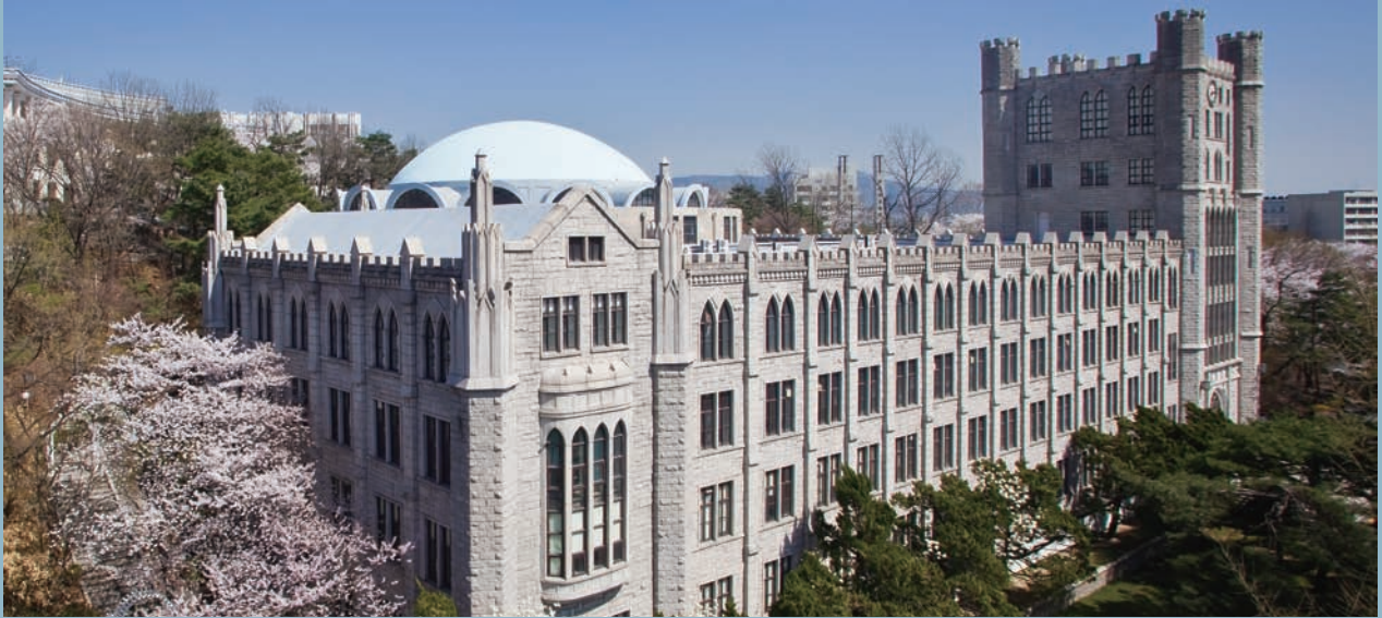
서울캠퍼스 중앙도서관은 137만 권의 장서를 기반으로 온·오프라인이 결합된 최첨단 도서관 시스템을 구축하게 된다.

개교 70주년 완공 목표, 건축추진위원회 구성해 세부계획 수립 중 조인원 총장, “최첨단 온·오프라인 결합, 세계와 소통하는 도서관 만들 것”