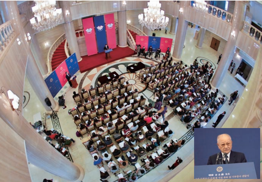
청강 김영훈 선생 유품 근대문화유산 문화재 지정 축하 및 기부증서 전달식. 작은 사진은 유족 대표인 김기수 전 포르투갈 대사.

유족, 근대문화유산 955점 포함 역사자료 1,600여 점, 토지 46만 m ² 기증 3대에 걸친 경희사랑 실천, “한의학 발전에 사용해줄 것” 당부